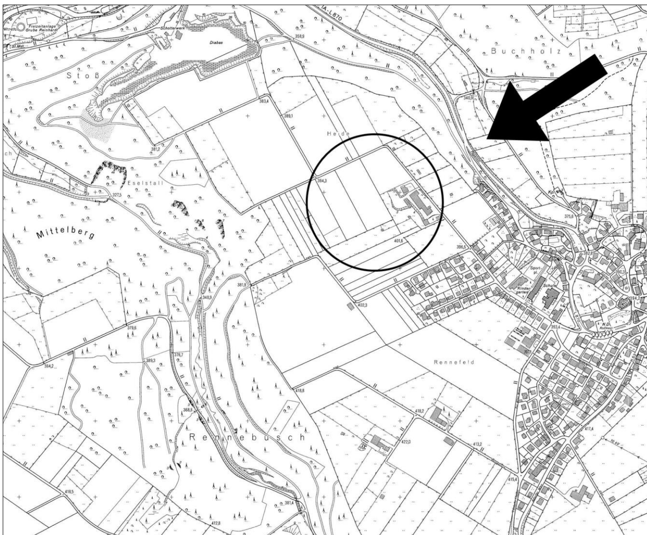
Abbildung 1 - Verortung der verfahrensgegenständlichen Flächen im Stadtteil

zuzuordnen und werden intensiv landwirtschaftlich, überwiegend ackerbaulich, mit weitgehend monotoner Flächenstruktur genutzt.