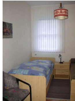
Schlafz. kl. 10,00 qm