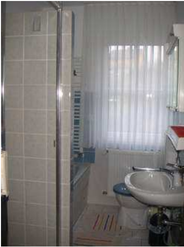
Bad 4,00 qm

Über den Flur gelangen Sie dann links in das Bade-zimmer mit Badewanne, separate Dusche, WC, Spiegel-schrank, Fön und beheiztem Handtuchhalter.