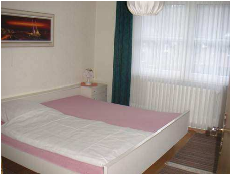
Schlafzimmer groß 15,00 qm

Wenn Sie den Flur betreten kommen Sie links in das große Schlafzimmer mit einem Doppelbett, Kleiderschrank und Spiegelkommode, Kofferablage, 2 Stühle und Radiowecker. Im nächsten Raum befindet sich das kleine Schlafzimmer mit 2 Einzelbetten und dem Kleiderschrank.