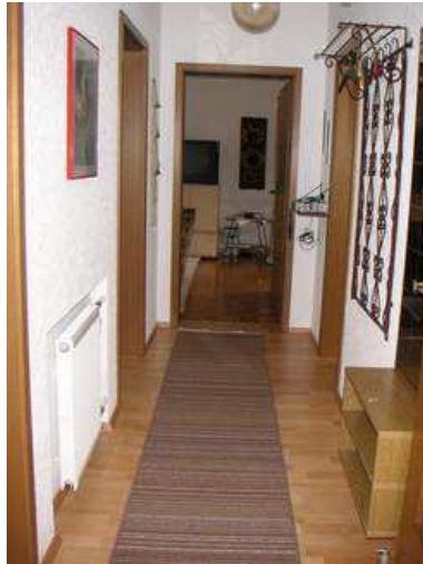
Flur 6,00 qm

Bei dieser Wohnung handelt es sich um eine komplett renovierte Nichtraucherwohnung . Alle Fenster sind mit elektrischen Rollläden ausgestattet. Bett- und Küchenwäsche wird kostenlos gestellt. Tageszeitung vorhanden.