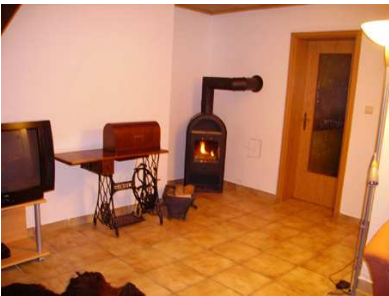
Kaminofen für gemütliche Stunden

Unsere Ferienwohnung wurde im Juni 2007 vom DTV mit 3 Sternen ausgezeichnet !!!