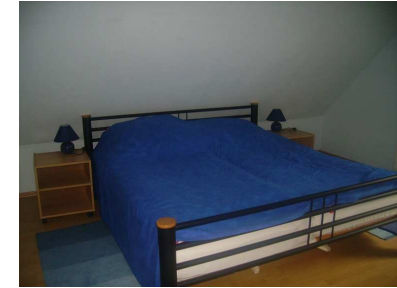
Schlafzimmer (Doppelbett 180x200)

Das Obergeschoss ist mit dem Untergeschoss durch eine steile Treppe miteinander verbunden und daher für körperlich Behinderte nur bedingt geeignet.