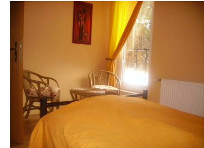
Schlafzimmer (Doppelbett 140 x 200)