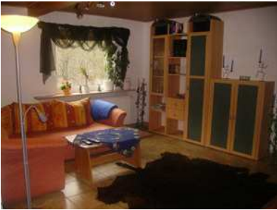
Wohnzimmer mit Sat-TV, Hifi-Anlage, DVD und Video-Spieler, Info-Mappe über Umgebung und Sehenswürdigkeiten,...