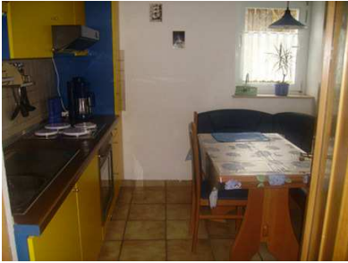
Küche mit allem was man benötigt (Gewürze, Kaffeefilter, ...)