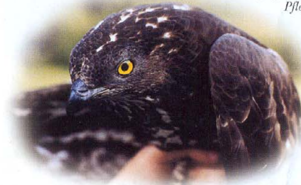
Ein Wespenbussard nach erfolgreicher Pflege